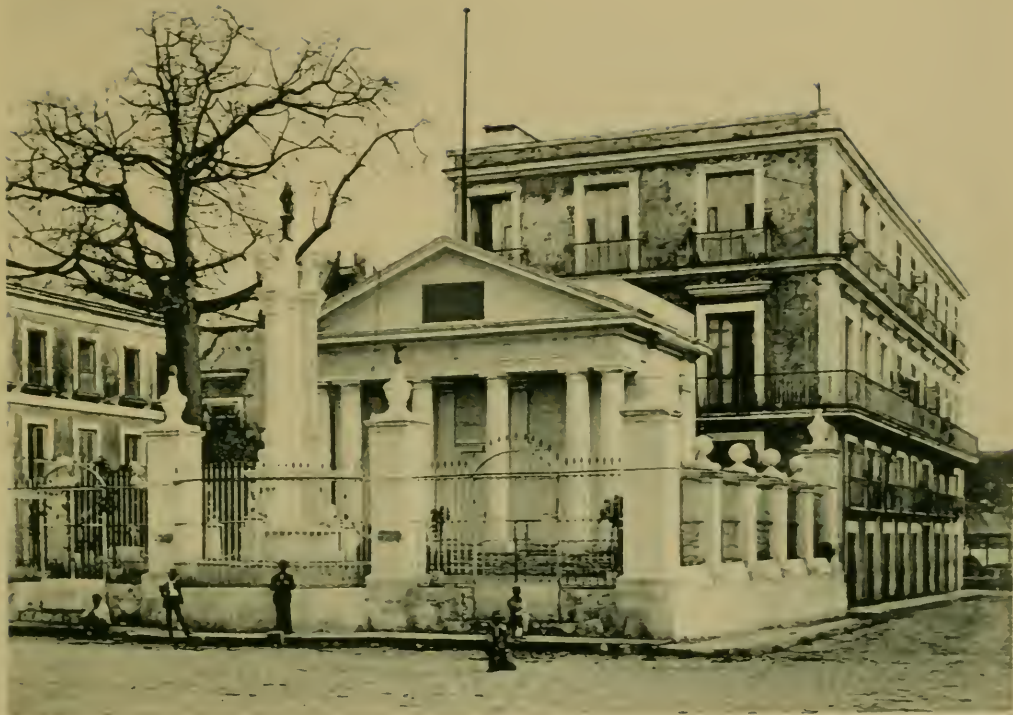
Templo de Colon. Columbus Monument, where Columbus attended the first Mass.